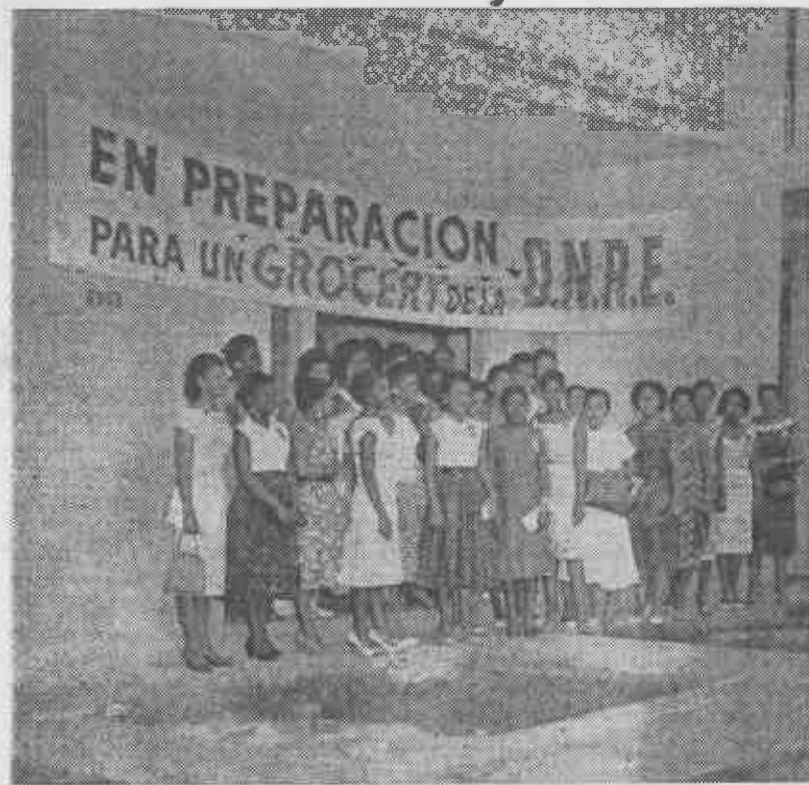
En la foto, las compañeras del cuadro femenino en la puerta del local que con fines comerciales, teníamos en la calle 120 No. 6,303, Marianao, y el cual fue asaltado y robado por miembros del S.I.M.

sión de que no era posible penetrar en las sociedades negras para sanearlas y convertirlas en un aparato útil para nuestras reivindicaciones, siendo necesario en tal caso construir una nueva maquinaria, que obviara los defectos de la existente, para intentar con él conquistarle al hombre negro la felicidad. Y es así que surge la organización Nacional de Rehabilitación Económica, con los fines y el carácter expuestos en esta obra.