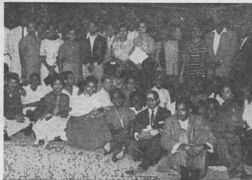
En la foto se encuentran los responsables de la O.N.R.E. de los 43 barrios de la Habana, algunos profesores de la Escuela que hemos puesto a funcionar en la Federación Nacional de Sociedades Negras de Cuba y algunos otros responsables del Ejecutivo Central de la mencionada Organización.

Fué así que le dijimos a los muchachos de la Juventud que el Ejecutivo había decidido tomar el local de la Federación Nacional de Sociedades Negras, en bien de la raza y en bien de la nación, por lo que salieron en número de 25 y en tres máquinas a realizar el trabajo, comunicándole telefónicamente a la oficina de la O.N.R.E., media hora después, que la operación se había realizado sin dificultad, y que ya se encontraban instalados en el local de mención.